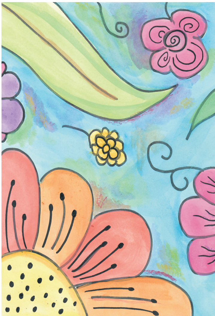
Tonči Cecić: Proljeće, 7. razred OŠ Grohote