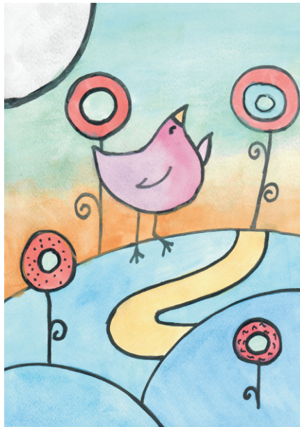
Maja Firizin: Ptica, 7. razred OŠ Grohote