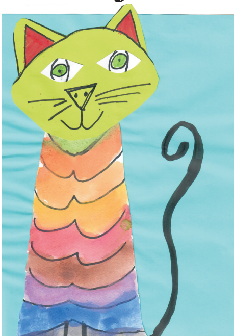
Toni Firizin: Mačka, 2. razred OŠ Grohote