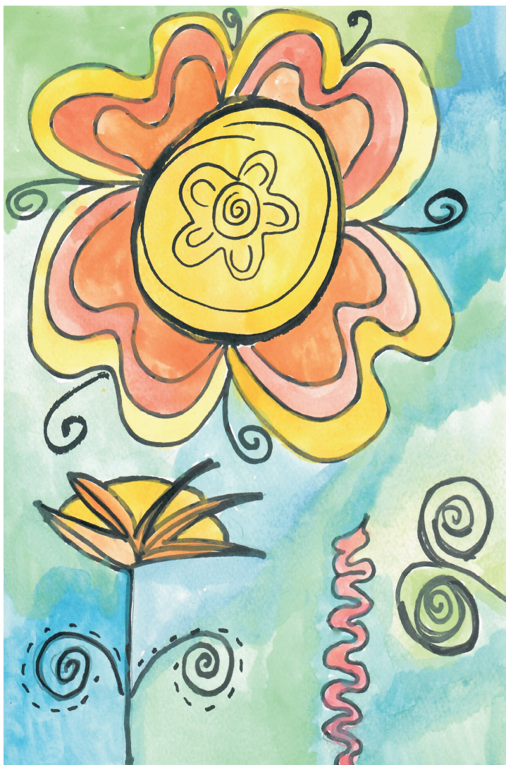
Josipa Blagaić: Proljeće, 5. razred OŠ Grohote