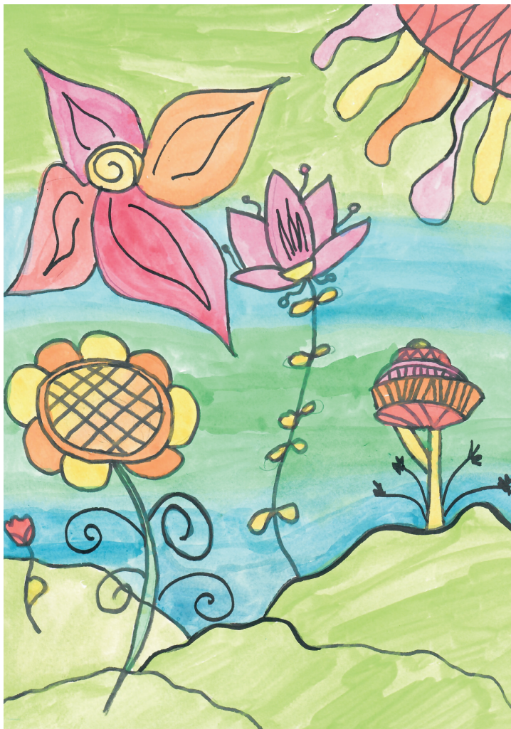
Nikol Radić: Proljeće , 7. razred OŠ Grohote