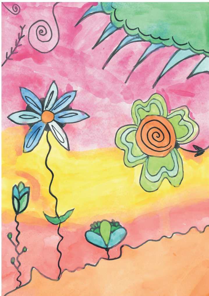
Josipa Blagaić: Proljeće, 5. razred OŠ Grohote