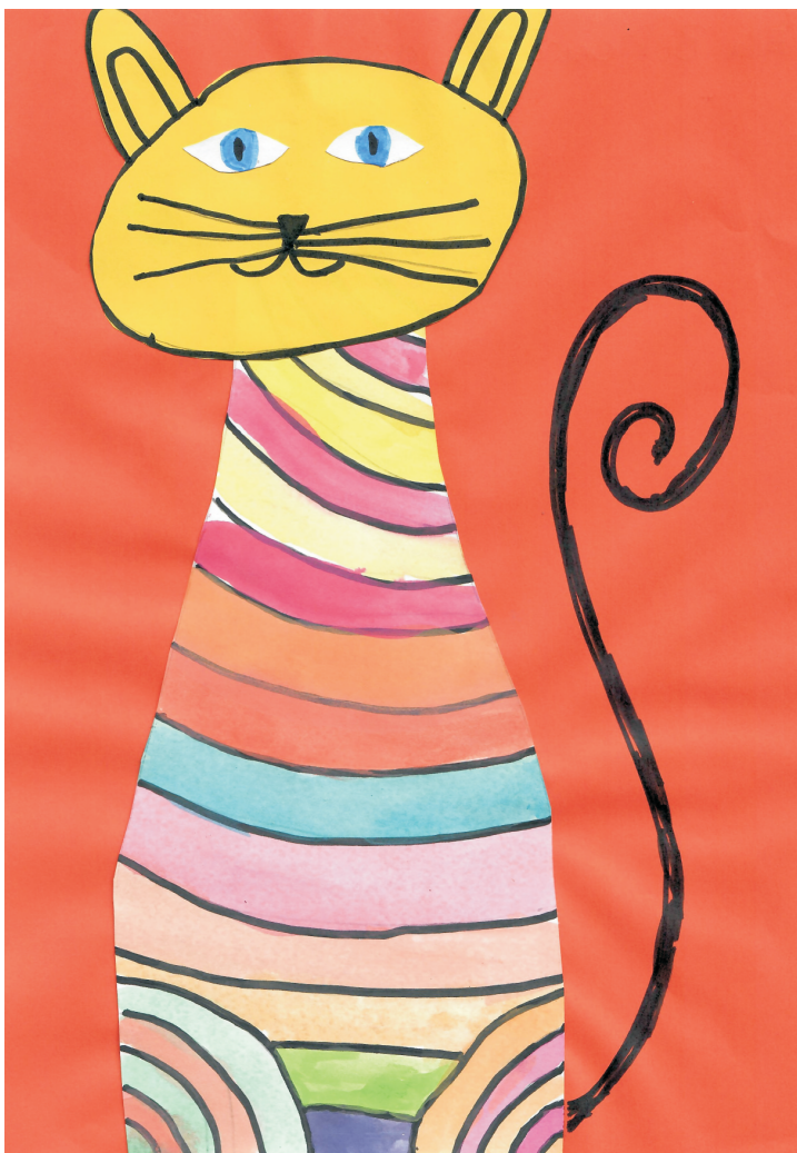
Ella Buktenica: Mačka, 2. razred OŠ Grohote