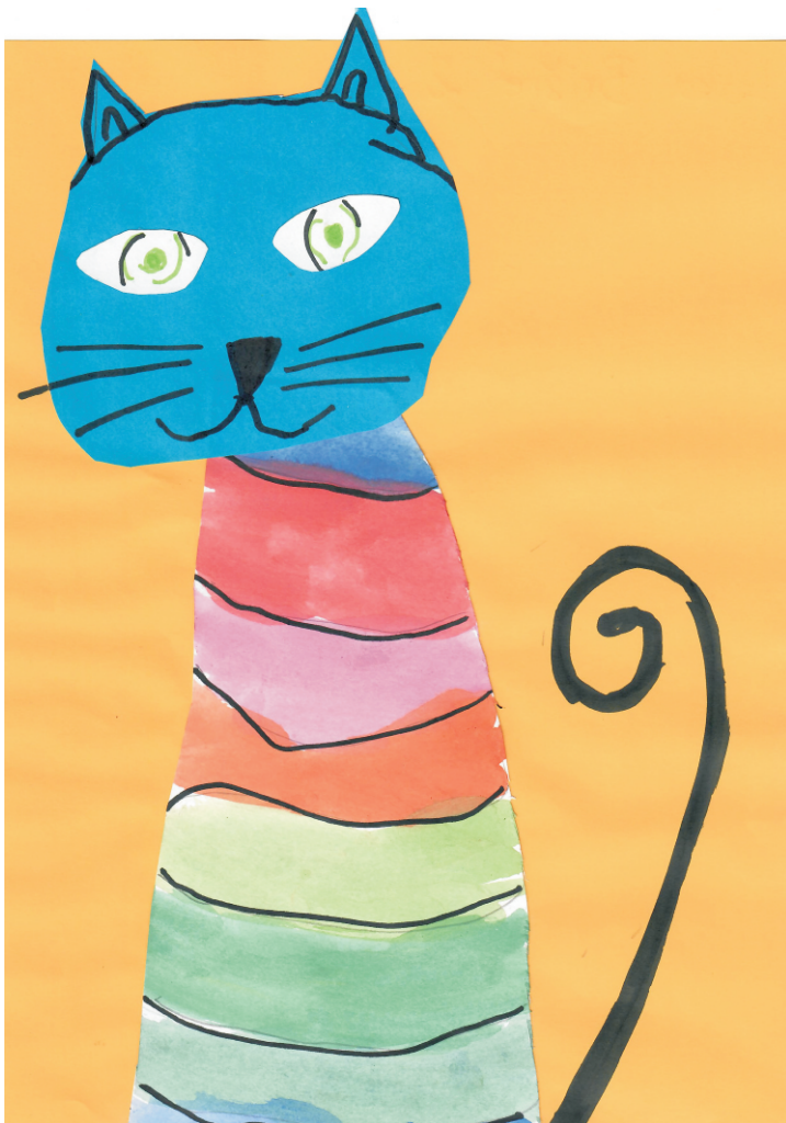
Luka Brižić: Mačka, 2. razred OŠ Grohote