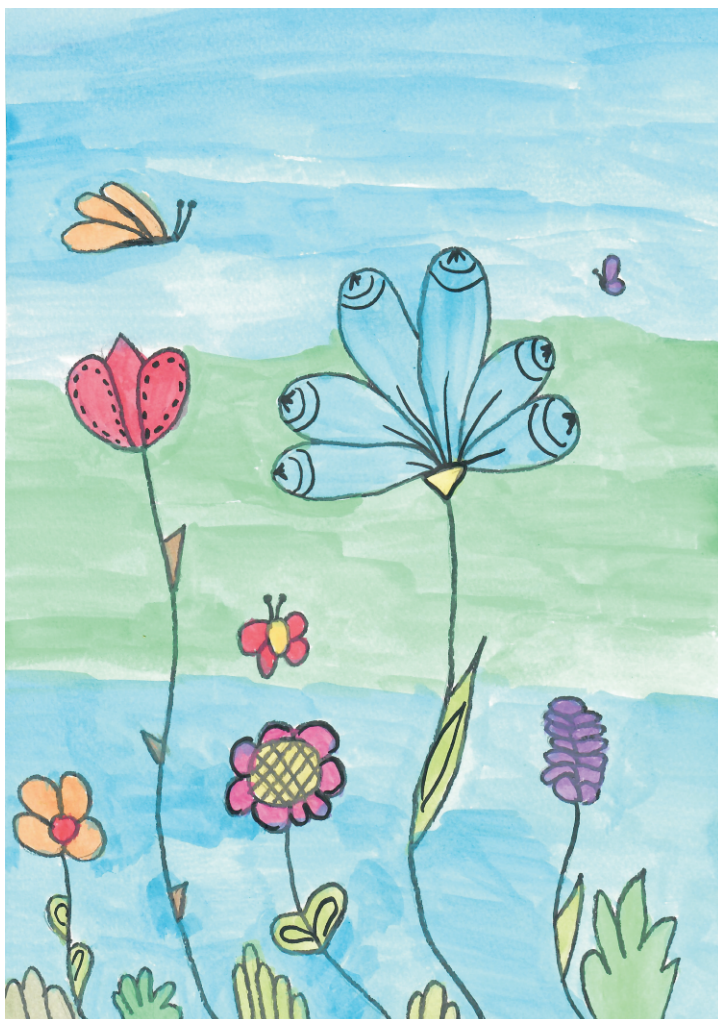
Nikol Radić: Proljeće, 7. razred OŠ Grohote