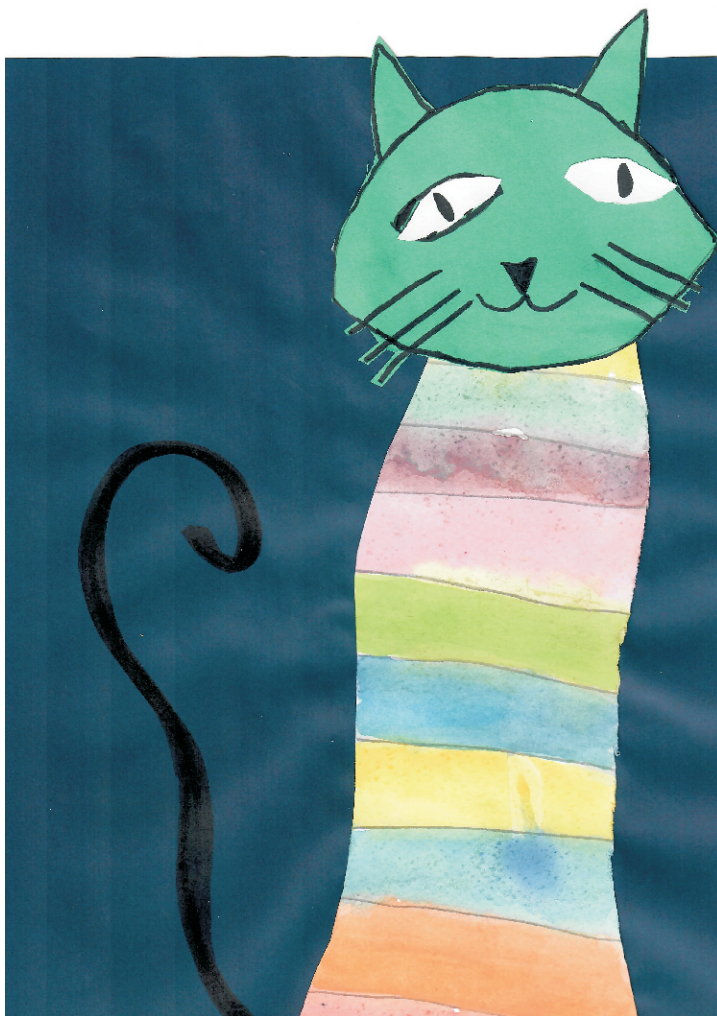
Bepo Begović: Mačka, 2. razred OŠ Grohote