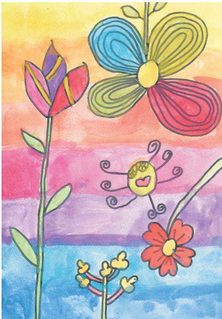
Ella Buktenica: Proljeće, 2. razred OŠ Grohote