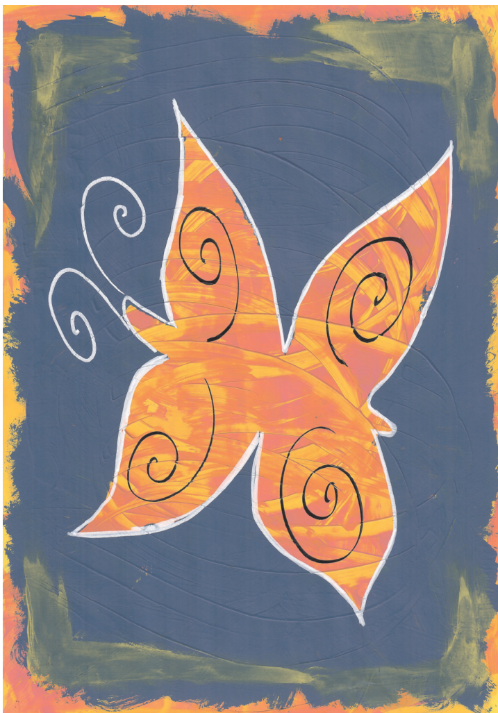
Petra Begović: Leptir, 6. razred OŠ Grohote