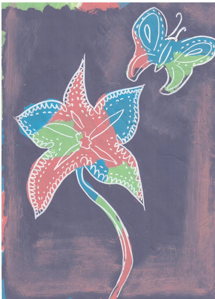
Mia Škrabanić: Leptir i cvijet, 5. razred OŠ Grohote