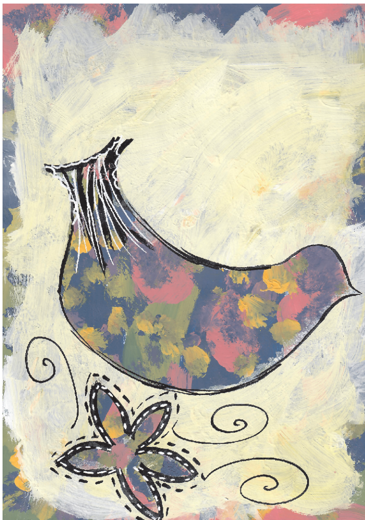
Lina Blagaić: Ptica, 6. razred OŠ Grohote