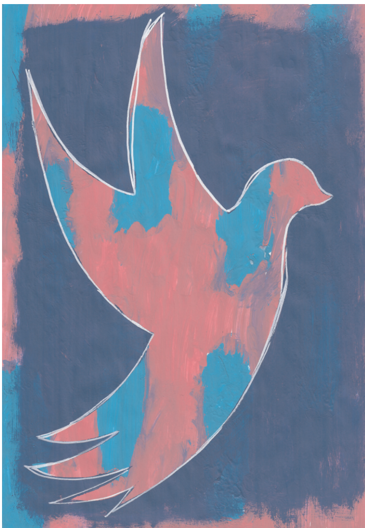
Tonči Ceci: Ptica, 5. razred OŠ Grohote