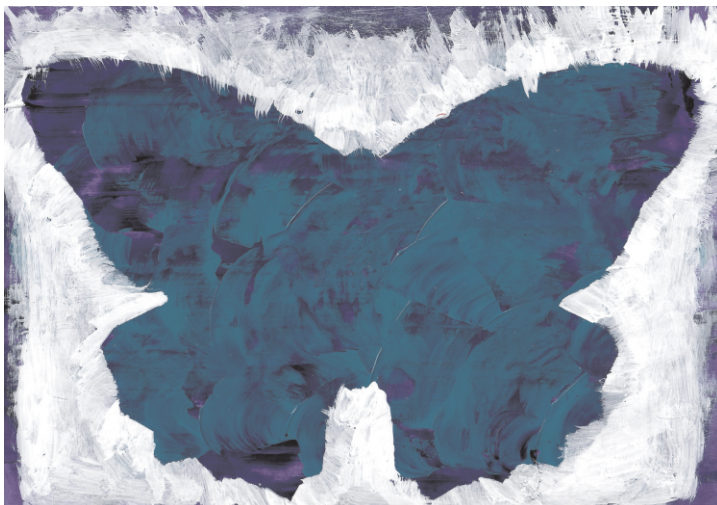
Petra Škrabanić: Leptir, 6. razred OŠ Grohote