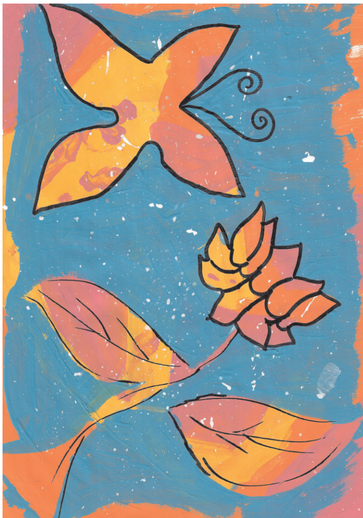
Tea Pipunić: Livada, 7. razred OŠ Grohote