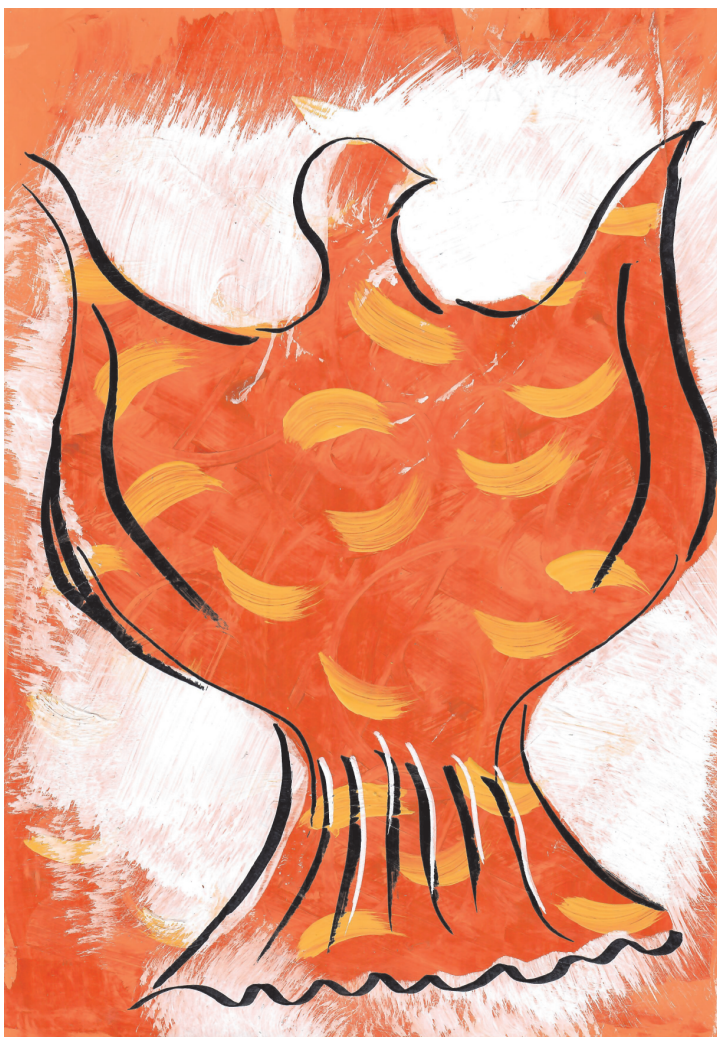
Tea Pipunić: Ptica, 8. razred OŠ Grohote