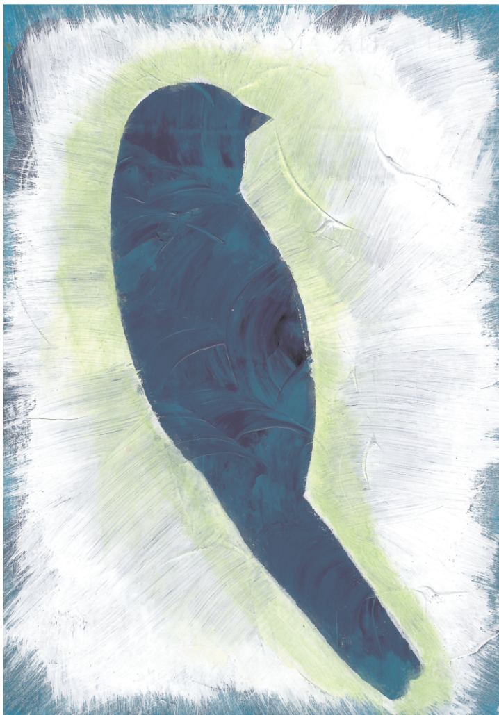
Lina Blagaić: Ptica, 5. razred OŠ Grohote