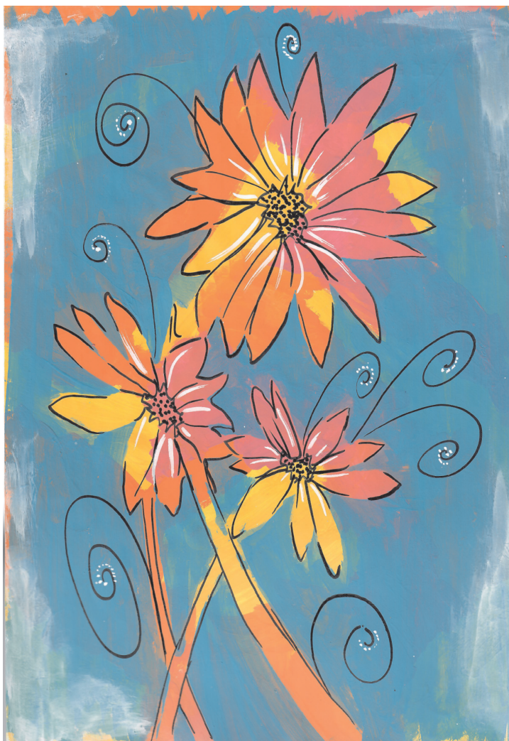
Nera Dea Balić: Cvijeće, 8. razred OŠ Grohote