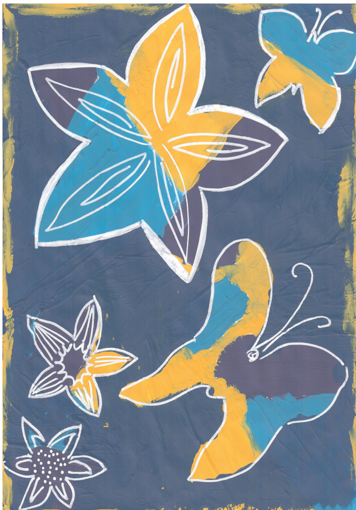
Nikol Radić: Livada, 5. razred OŠ Grohote