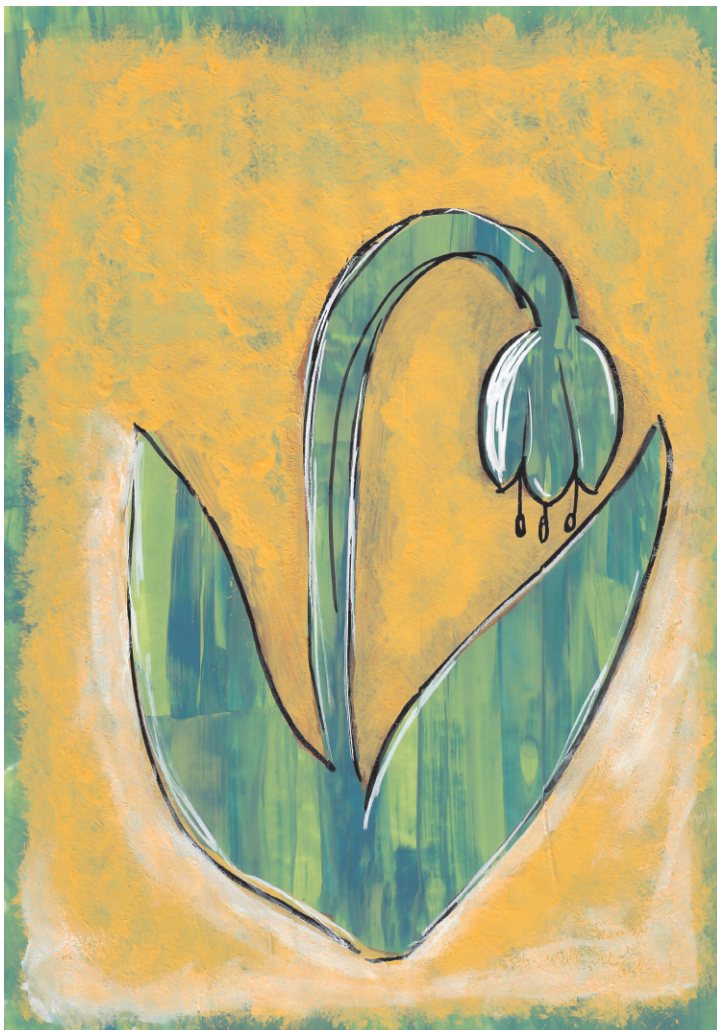
Tonči Cecić: Visibaba, 5. razred OŠ Grohote