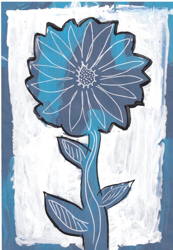
Petra Škrabanić: Cvijet, 6. razred OŠ Grohote