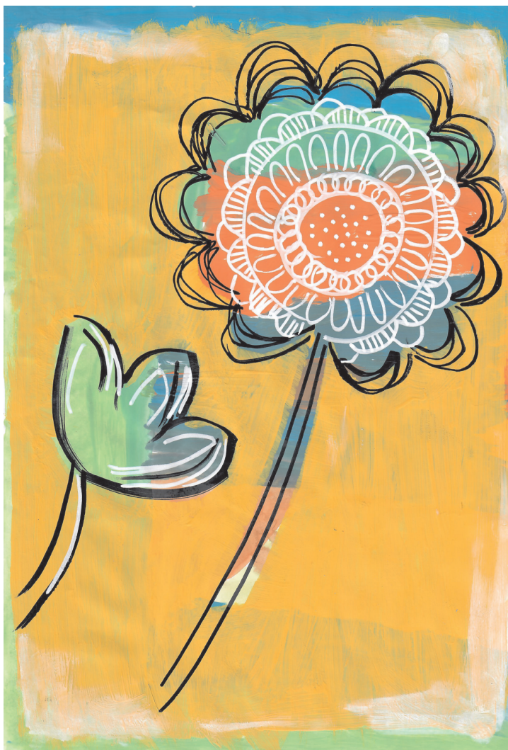
Mia Škrabanić: Cvijet, 5. razred OŠ Grohote