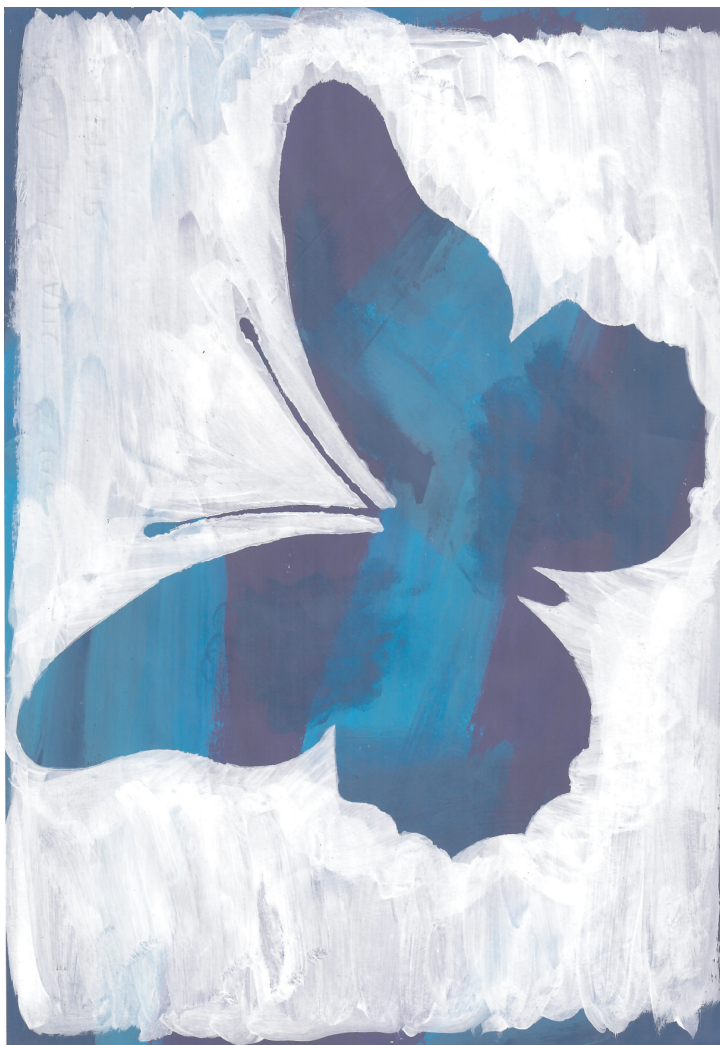
Nera Dea Balić: Leptir, 8. razred OŠ Grohote