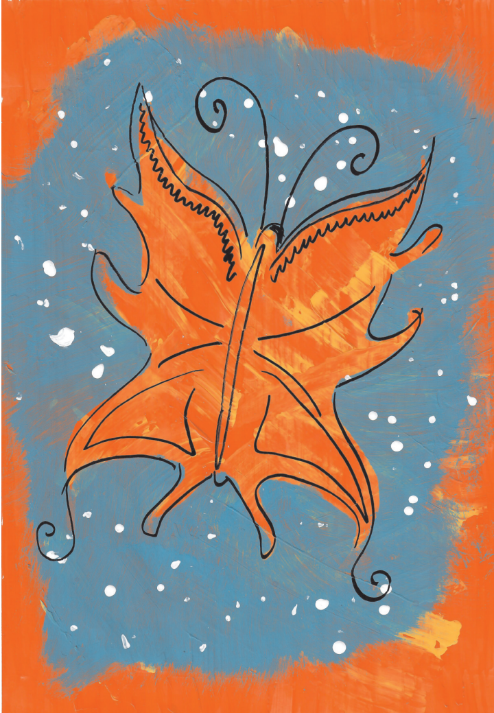
Maja Firizin: Leptir, 5. razred OŠ Grohote