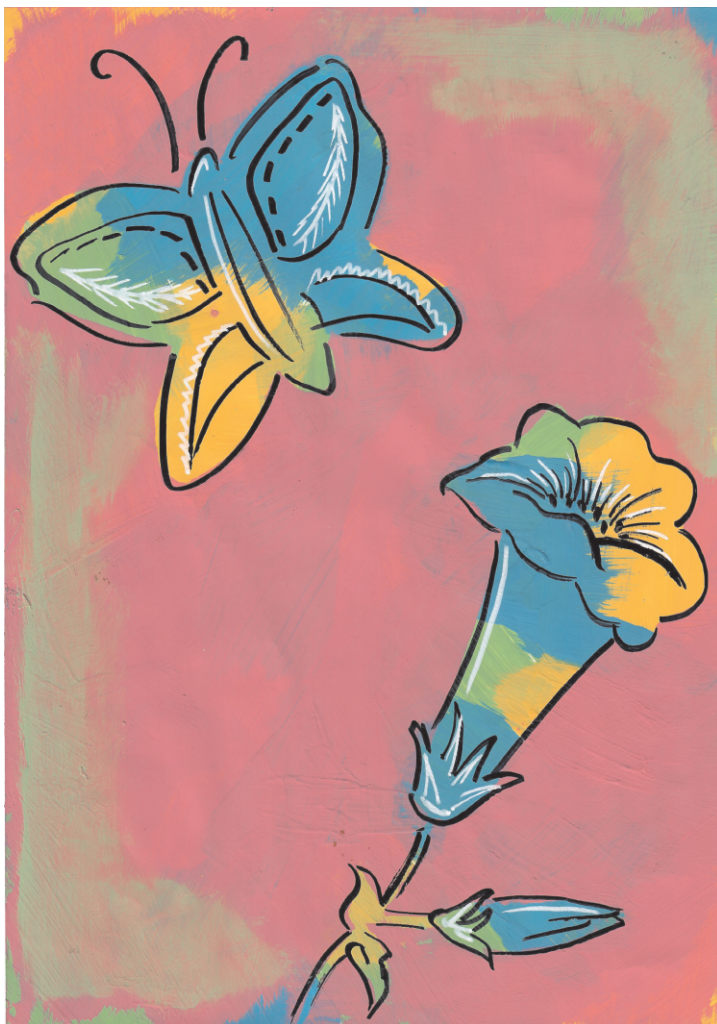
Lina Blagaić: Cvijet i leptir, 6. razred OŠ Grohote