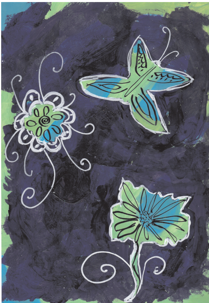
Nikol Radić: Livada, 5. razred OŠ Grohote