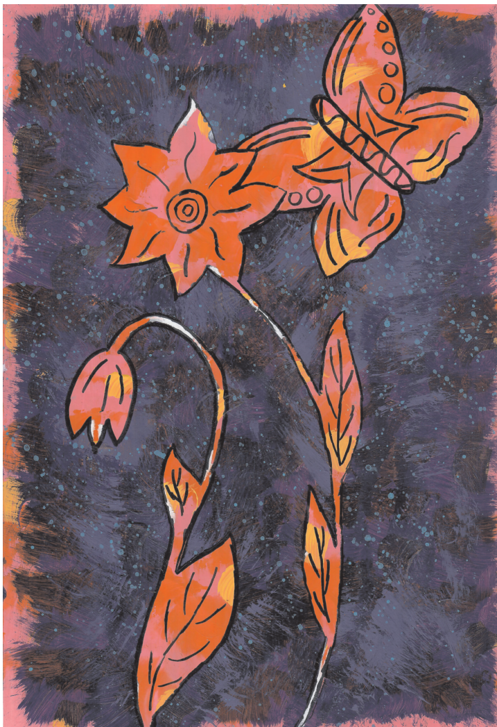
Nera Dea Balić: Livada, 8. razred OŠ Grohote