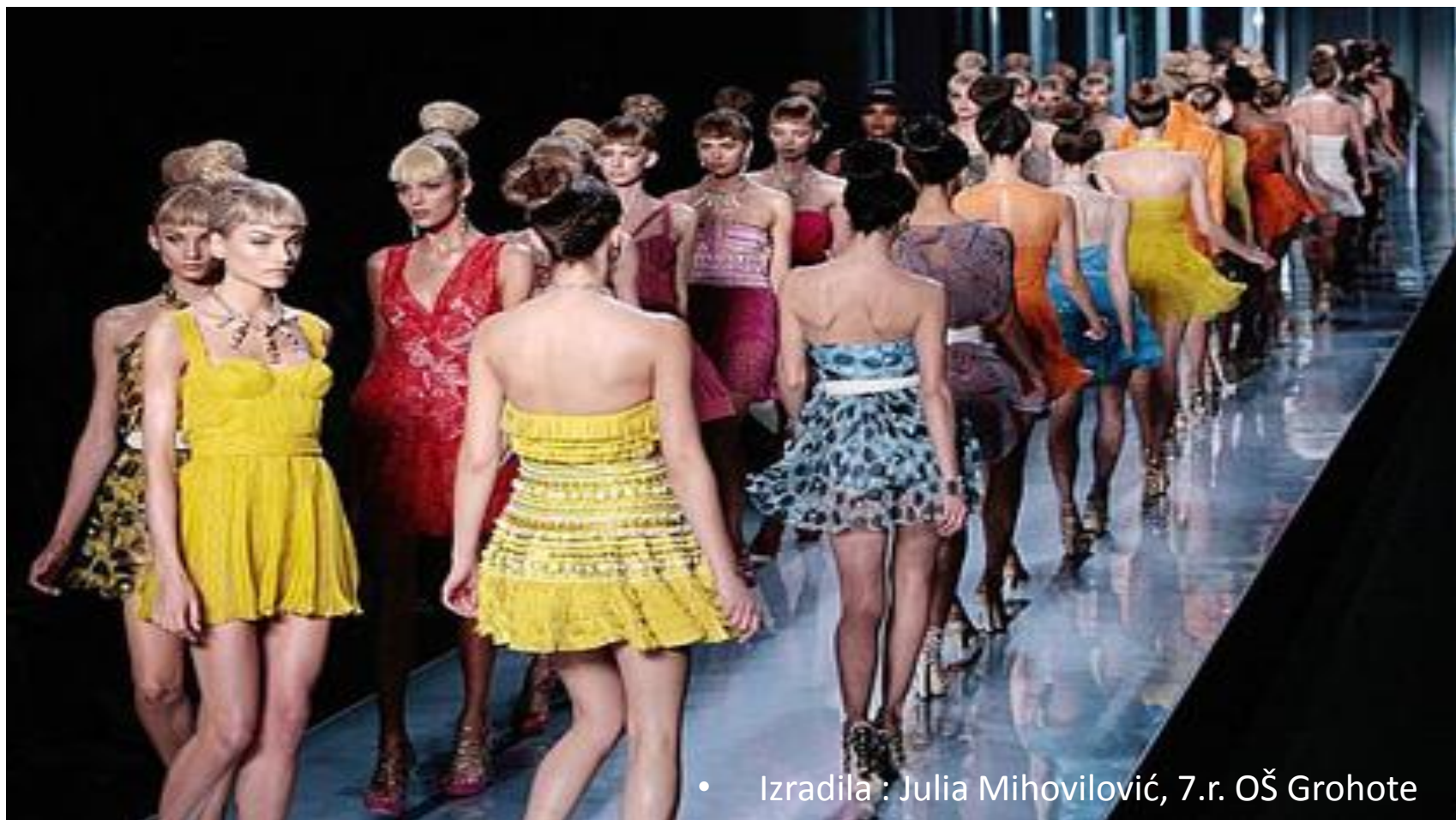
• Izradila : Julia Mihovilović, 7.r. OŠ Grohote